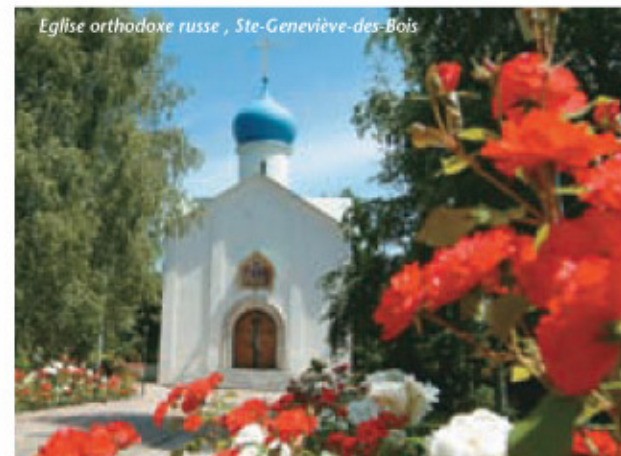
Eglise orthodoxe russe, Ste-Geneviève-des-Bois

1 Après être passé sous la N20, continuer toujours tout droit par la rue de la Libération. A l'église St Clément emprunter successivement les rues suivantes : rue de la Libération/rue L. Roger / 1 ère à droite rue Eugène Lagauche / 1 ère à gauche rue du Stade et revenir sur les chemins de l'Orge. Traverser la rue René Dècle pour reprendre le chemin de l'Orge. Traverser la route