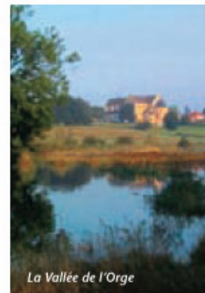
La Vallée de l'Orge

2 Prendre à gauche par le moulin du Basset pour rejoindre le bassin de Lormoy. Suivre l'Orge et traverser la rue du Docteur Darier, ainsi que l'Orge et suivre la Boële de St Michel jusqu'à l'avenue du Docteur Pinel.